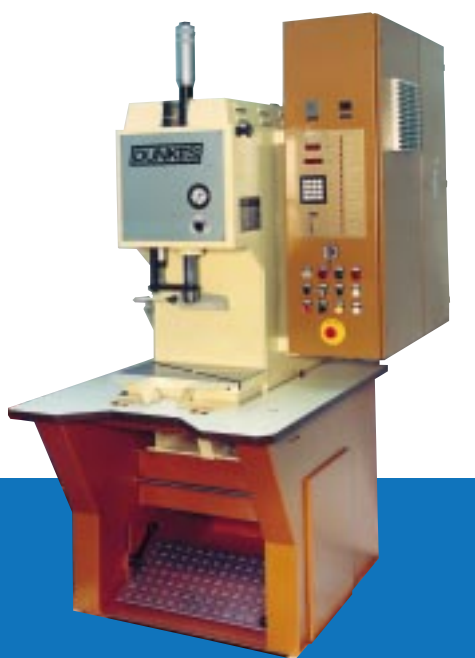
3. Einständer-Tischpresse mit NC-Steuerung, konzipiert als Sitzarbeitsplatz nach ergonomischen Gesichtspunkten, Preßkraft 40 kN