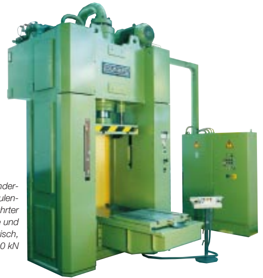
2. Doppelständer- presse mit säulen- geführter Stößelplatte und Schiebetisch, 2500 kN