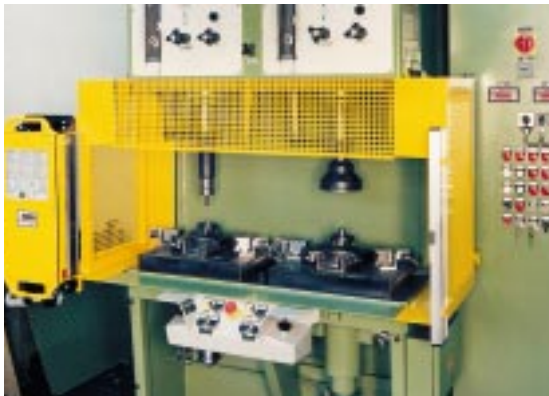
4. Montagepresse mit 2 Zylinder für parallel laufende Arbeitsgänge (je 100 kN)