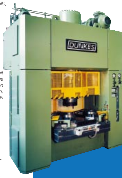
4. Doppelständerpresse mit V-Schiebetisch zur Montage und Kalibrierung von Statorpaketen, Preßkraft 4000 kN