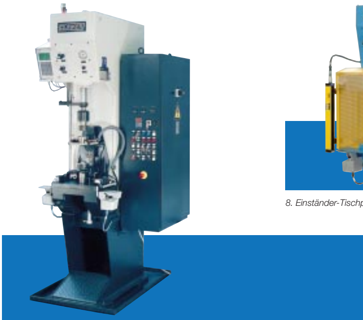
7. Einständer-Tischpresse auf Ständeruntersatz mit direkter Kraft-Weg-Kontrolle, 100 kN