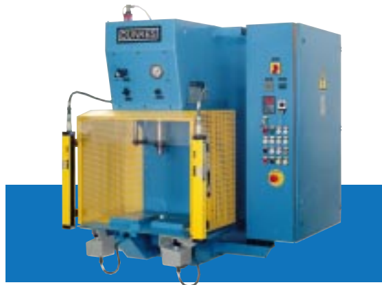
8. Einständer-Tischpresse mit Lichtschranke, 63 kN