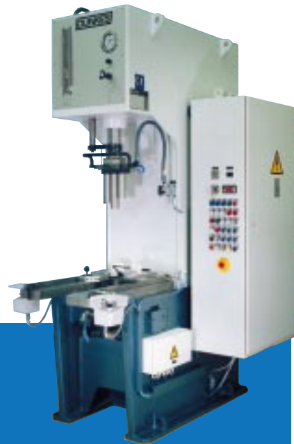
2. Einständer-Montagepresse mit Schiebetisch und Einpreßkraftkontrolle, Preßkraft 250 kN