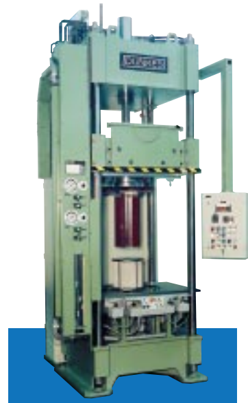
6. 4-Säulenpresse mit motorischem Drehantrieb unterhalb der Tischplatte, 250 kN