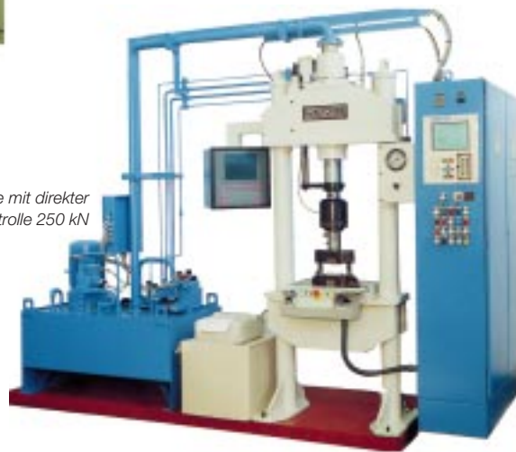
7. 2-Säulenpresse mit direkter Kraft-Weg-Kontrolle 250 kN