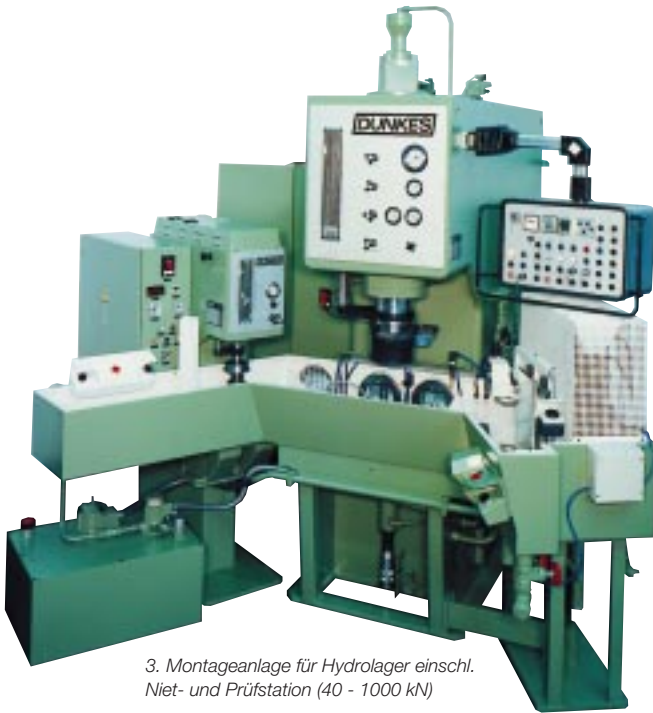
3. Montageanlage für Hydrolager einschl. Niet- und Prüfstation (40 - 1000 kN)