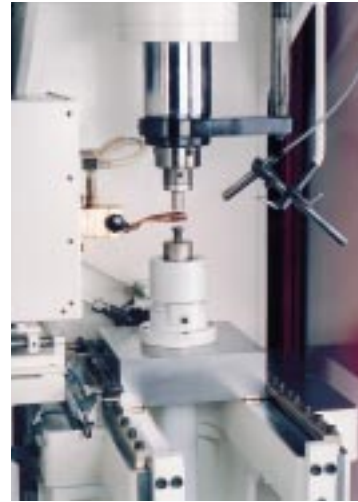
1a. Detail Schiebetisch mit Induktionsspule