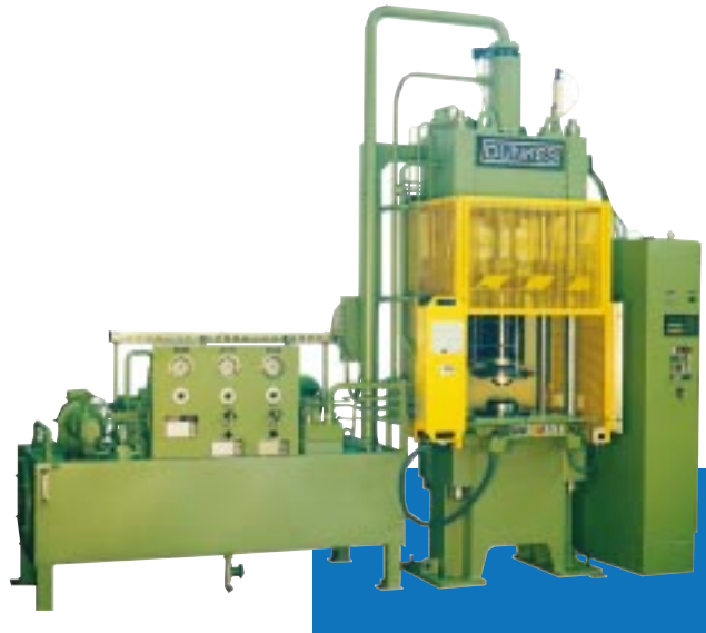
5. 4-Säulen-Montagepresse mit NC-Steuerung, Preßkraft 400 kN

Qualitätssicherung durch Messung des Kraft-Weg-Verlaufes und deren Dokumentation sind weitere wichtige Bestandteile dieses Produktbereiches.