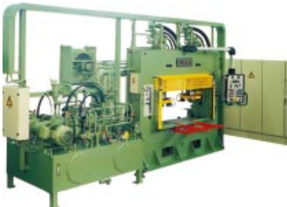
6. Rahmenpresse mit 2 gesteuerten Zylindern je 250 kN