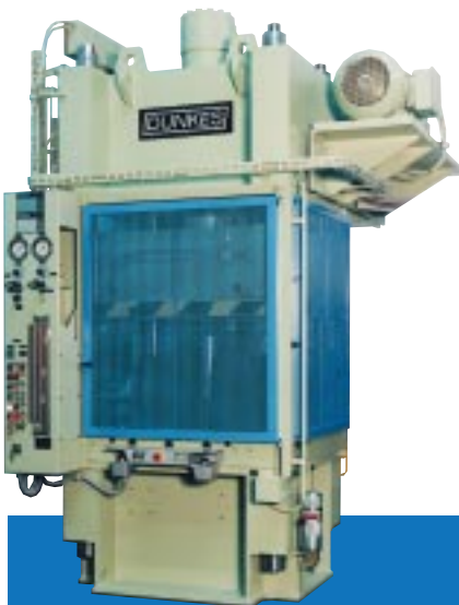
8. 4-Säulenpresse mit säulengeführter Stößelplatte, Schutzgitterabsicherung, 630 kN