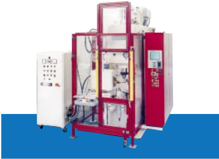
1. Einständerpresse mit CNC Steuerung und Induktionserwärmung, 400 kN