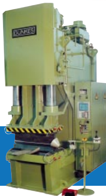
9. Zylindrige Einständerpresse mit feinfühlinger Handhebelsteuerung und servogeregelter Stößelachse, 2000 kN