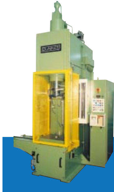
10. Einständerpresse mit Lichtschranke, Schiebetisch und Kraft-Weg-Kontrolle, 400 kN